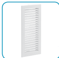
Решётка для вентканала